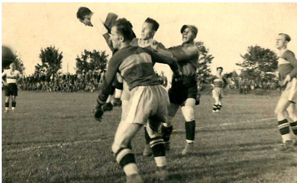
Phot. 3. 1934 Match „Resovia” – „Ukraina”