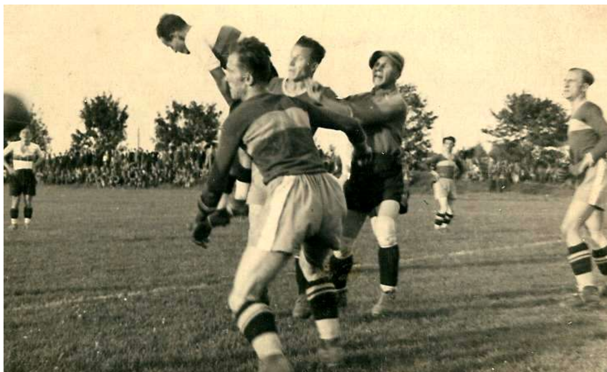
Fot. 3. 1934 r. Fragment meczu „Resovia” – „Ukraina”.