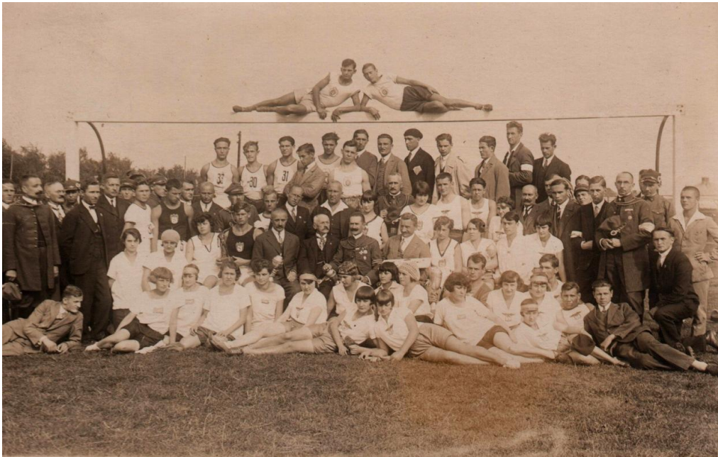
Photo 1. Commemorative photo of Sokół Gymnastic Association athletic section in Jarosław in 1914