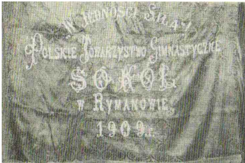
Phot.2. The banner of „Sokół”

Among few reminders of Bielecki, two photographs from 1908 deserve particular attention. The first one presents a march of "Sokół" group with its banner, the second one, commemorating ceremonial celebration of the 500th anniversary of the battle of Grunwald, shows an orchestra with count Potocki in the front before the wall of parish church, where the memorial plaque was located. The most interesting proof of functioning Society is undoubtedly preserved "Sokół" banner with the following inscription: "Polish Gymnastic Society 'Sokół' in Rymanów 1909" with slogan "In unity is strength" and image of falcon above oak leaves on the other side of the banner 20 .