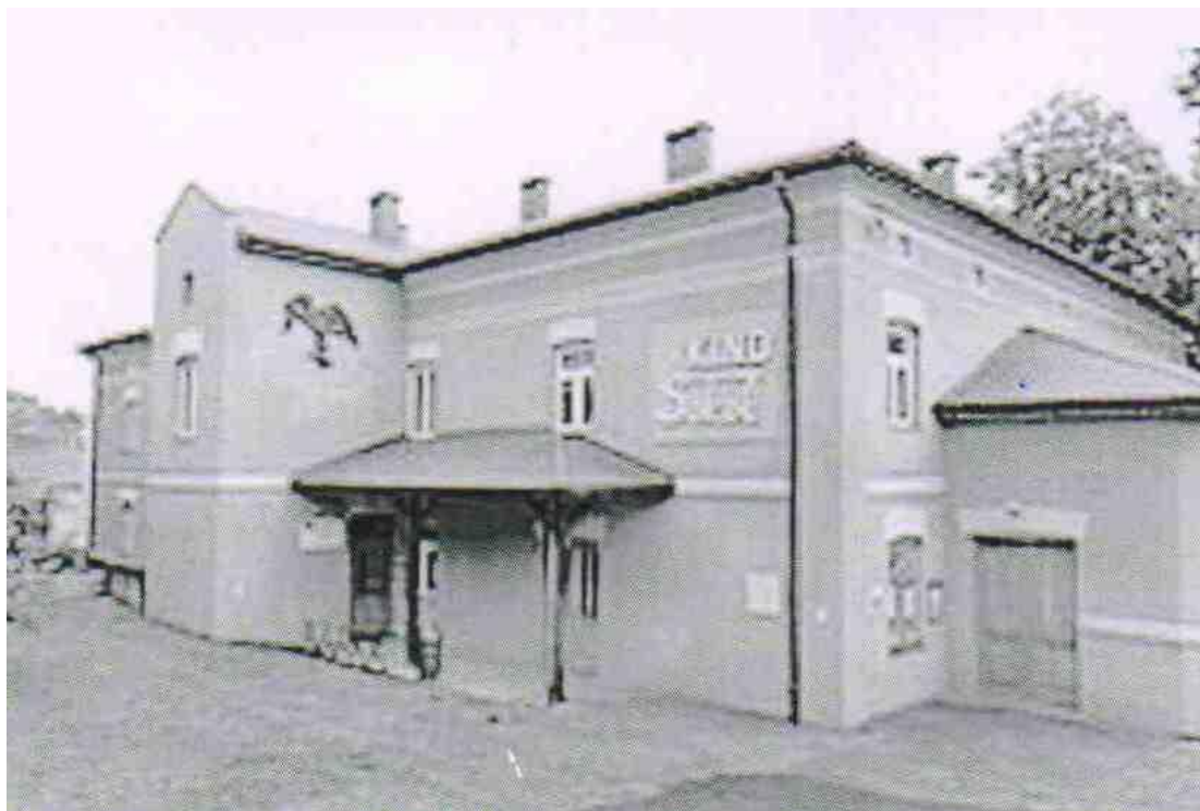
Phot. 5. Former building of Society „Sokół”, currently the cinema „Sokół”

In the newly built building state and public celebrations took place, moreover, social meetings, sport games or even weddings and dances. A library and a club functioned steadily. There was also activity of a sport club, a mixed choir, amateur artistic and theatrical groups. Charity in aid of poor children was run there too.