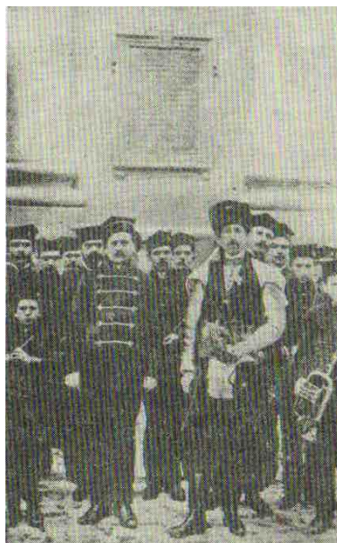
Phot. 3. Orchestra from Rymanów during the celebrations of the battle of Grunwald's anniversary

The Society gathered mostly the youth and adult from Rymanów and surrounding territories. However, in spite of its attractiveness, the Society struggled with, among other things, accommodation difficulties and was forced to use rented rooms in the city.