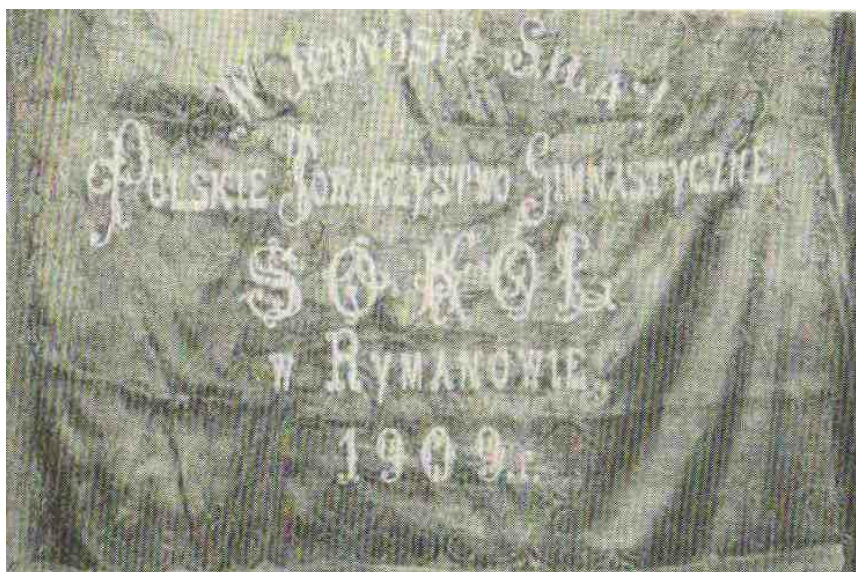
Fot.2. Sztandar „Sokoła”